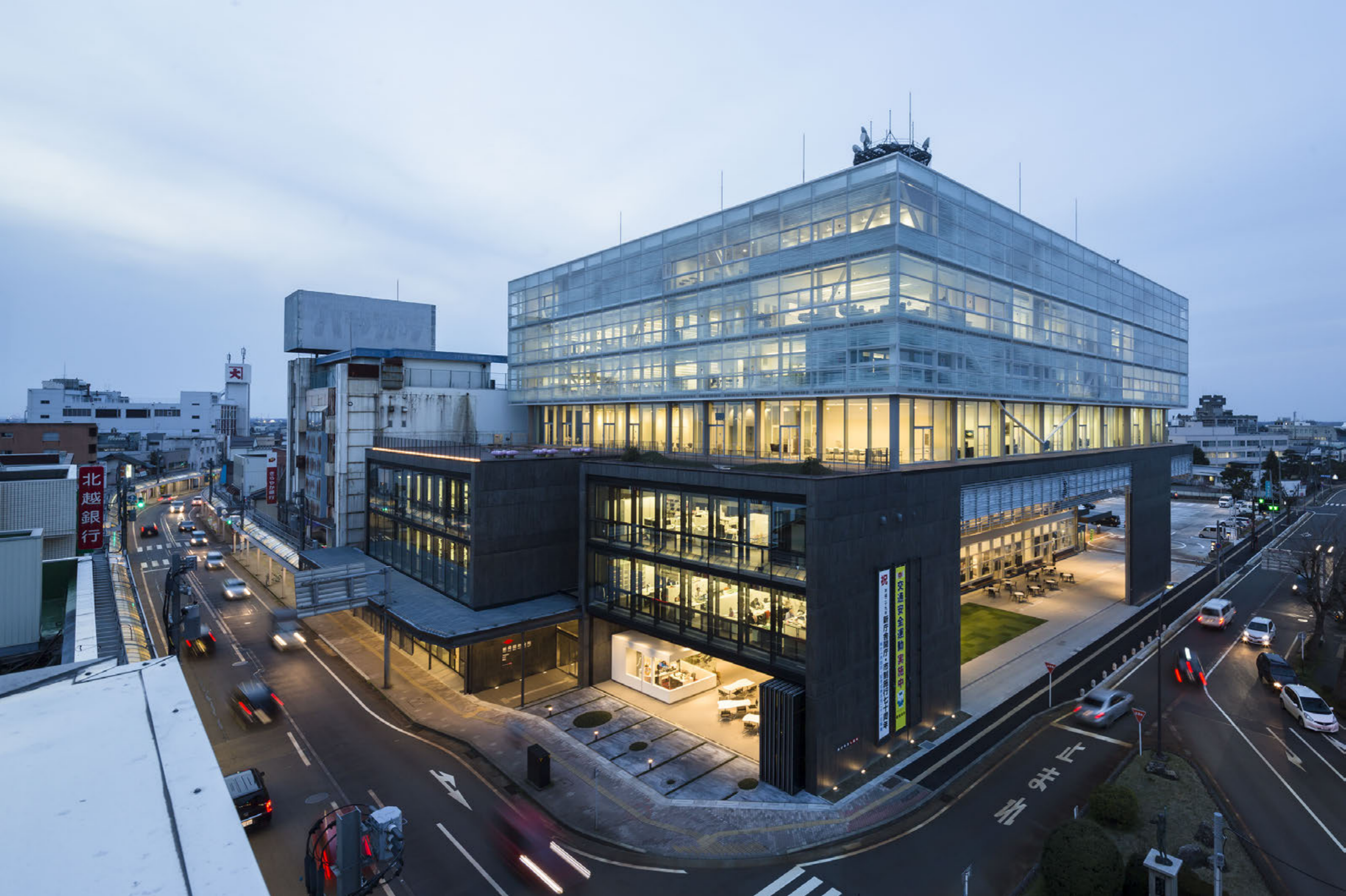
外観夕景 大型建具や大型シートシャッターの開閉により商店街と連続した都市広場が生まれる