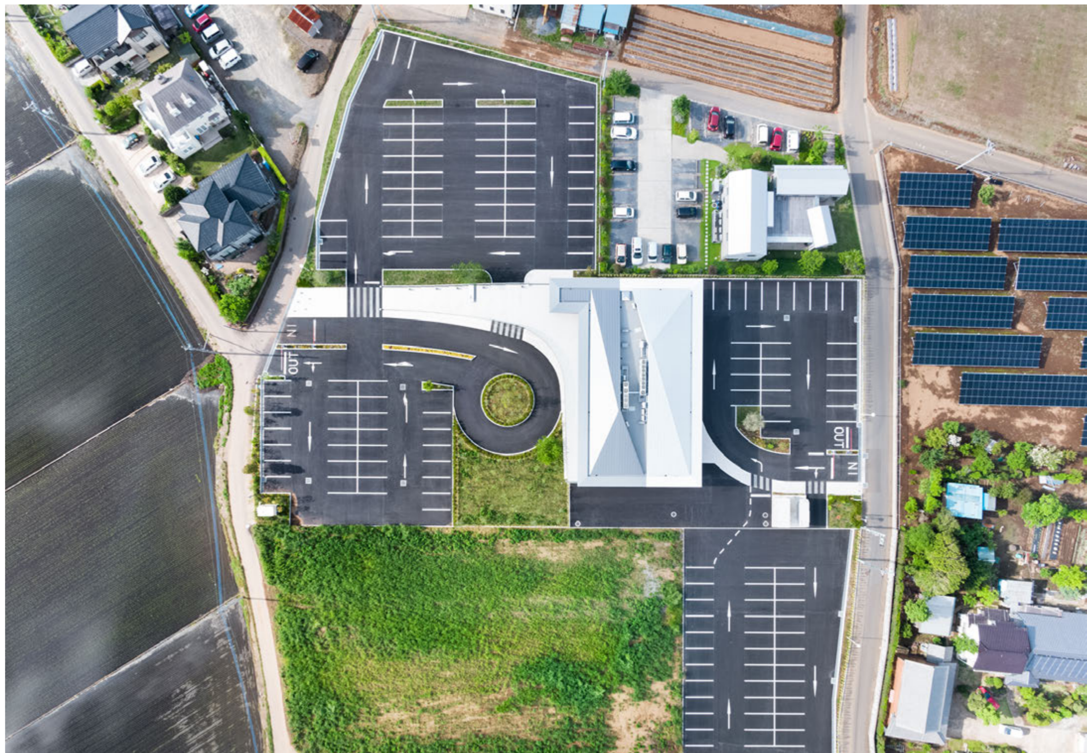
上空からの眺め 二つの領域を建物で分けている

設計 : 黒田潤三アトリエ + kaa. 所在地 : 茨城県つくば市 主要用途 : 診療所 構造 : RC 造 規模 : 地上2階 延床面積 : 1217.69㎡