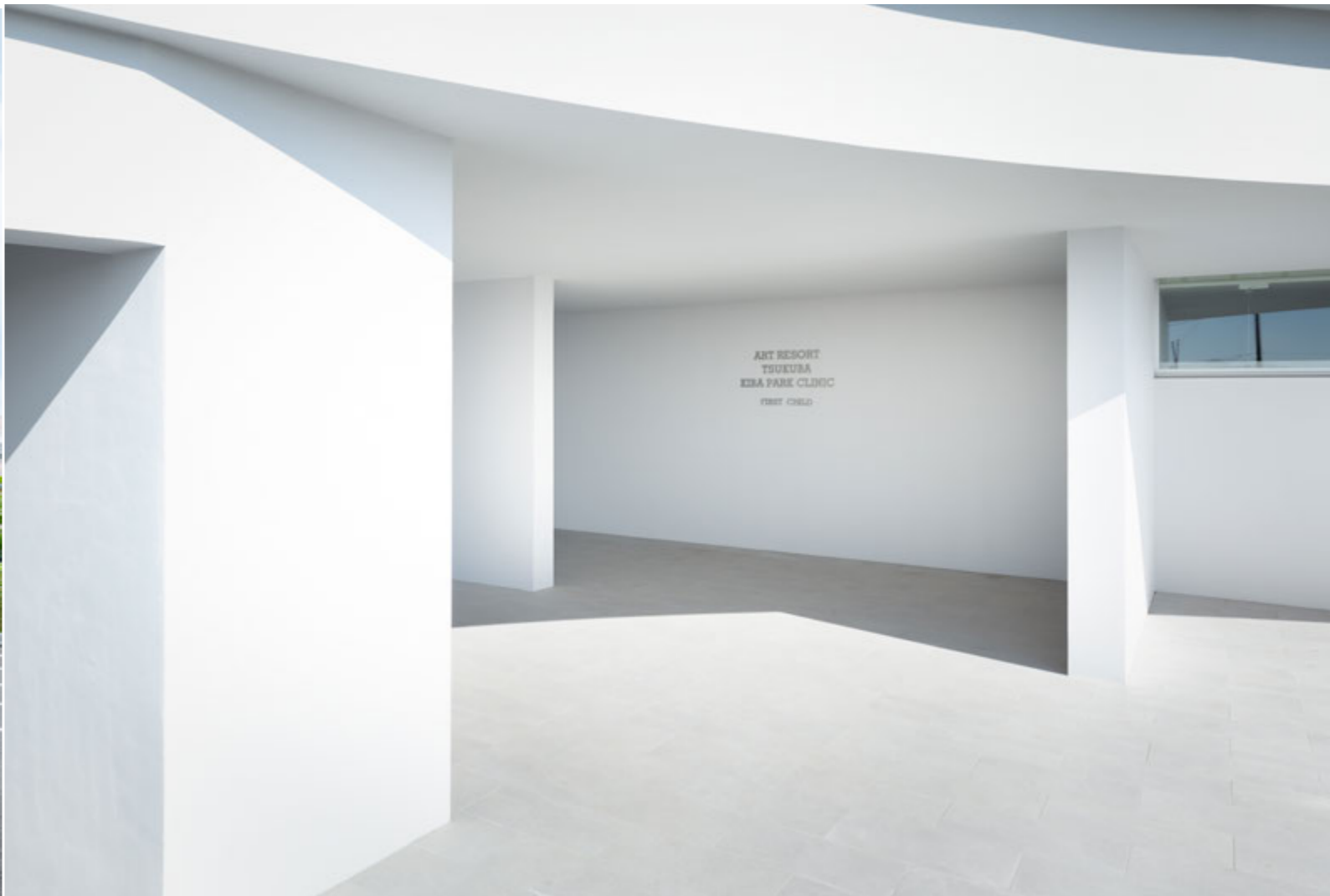
一人目エリアエントランス外観