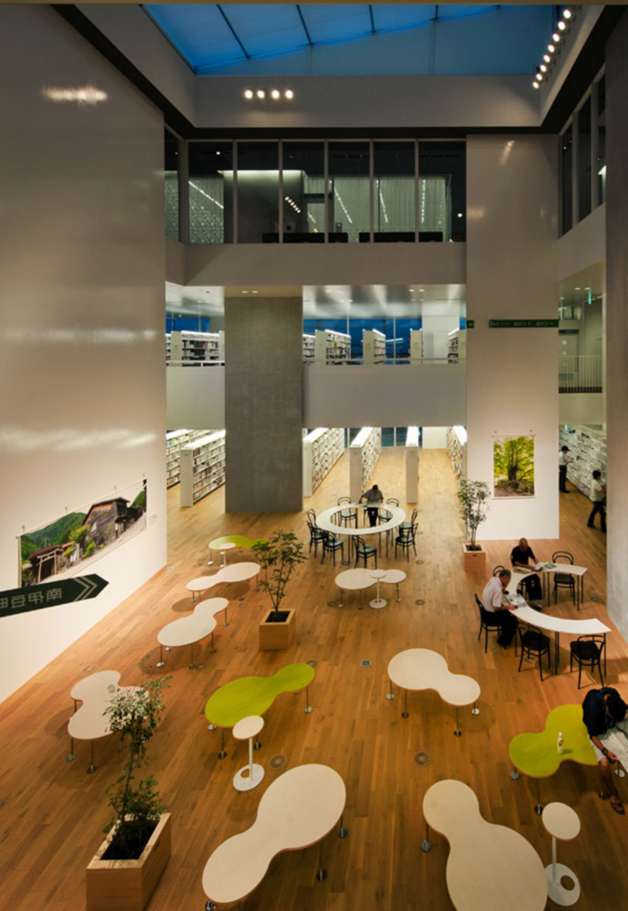
閲覧室「森のコート」