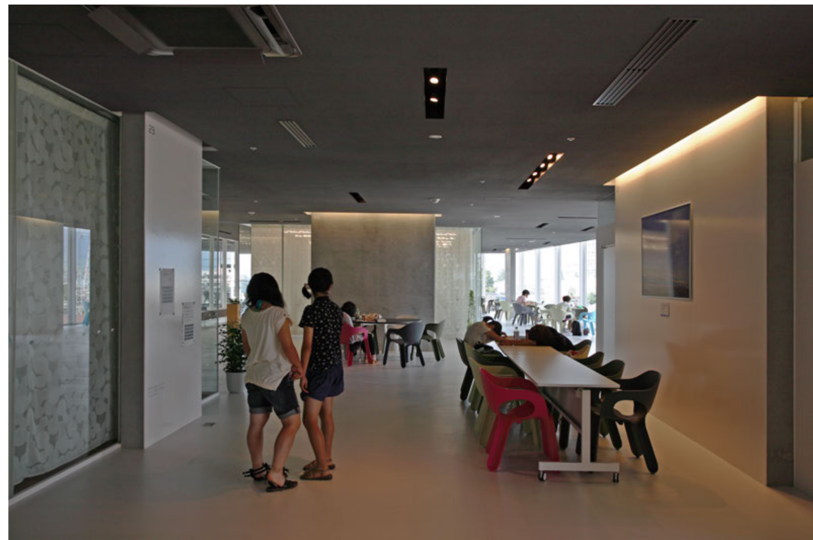
公園のように自由につかえる3階市民ラウンジ