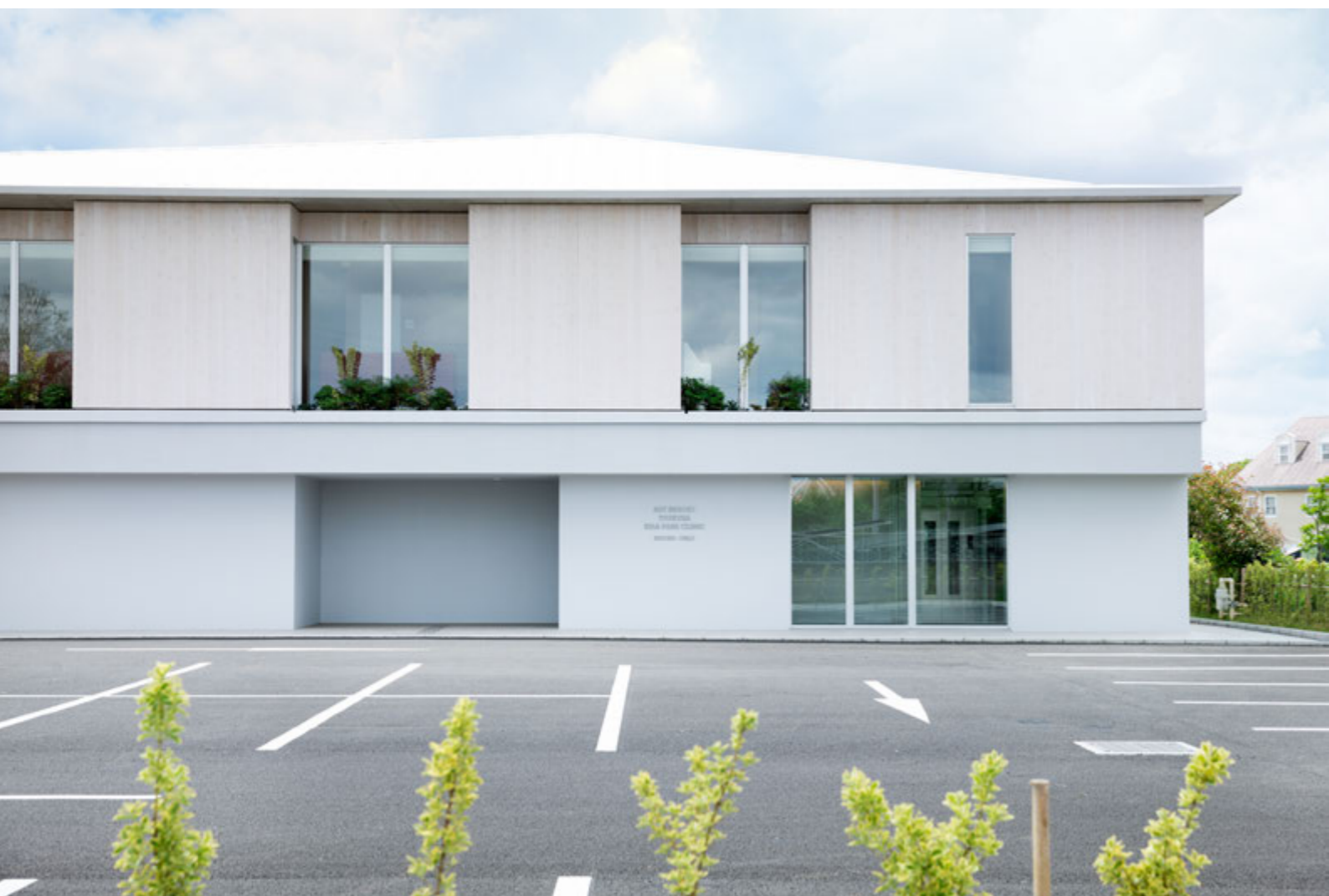
二人目エリアエントランス外観