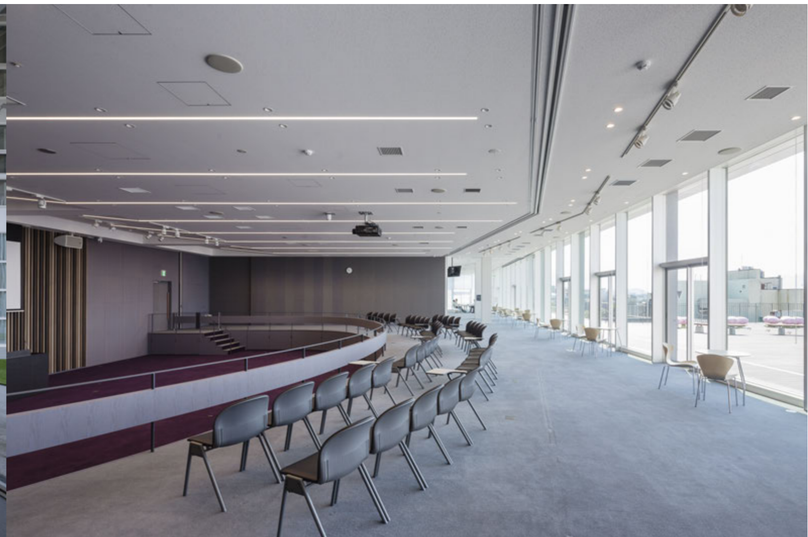
議場 議場家具を床下に収納し可動壁を開放することで屋上テラスと一体利用が可能なイベントスペースになる