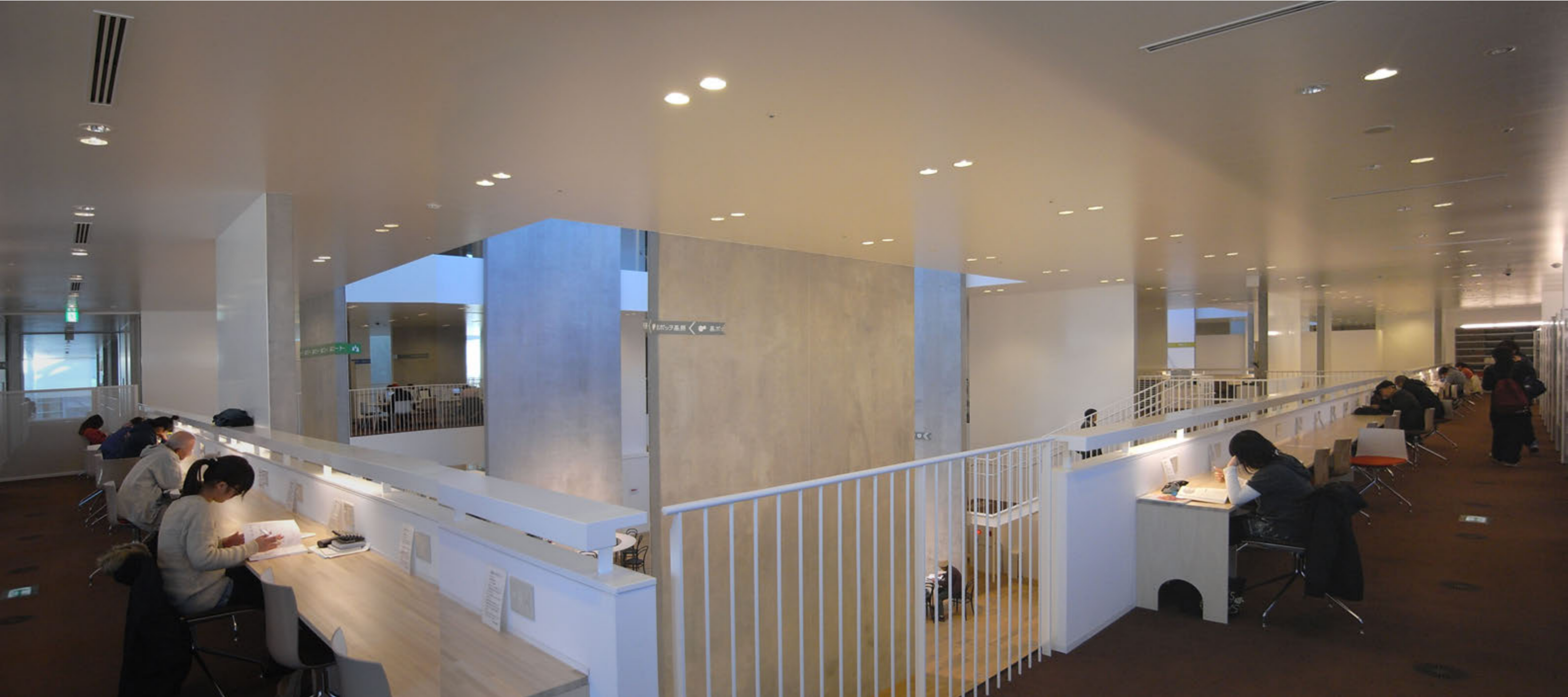
2階キャレルデスクからの内観 森の木々のように連続したイメージの壁柱