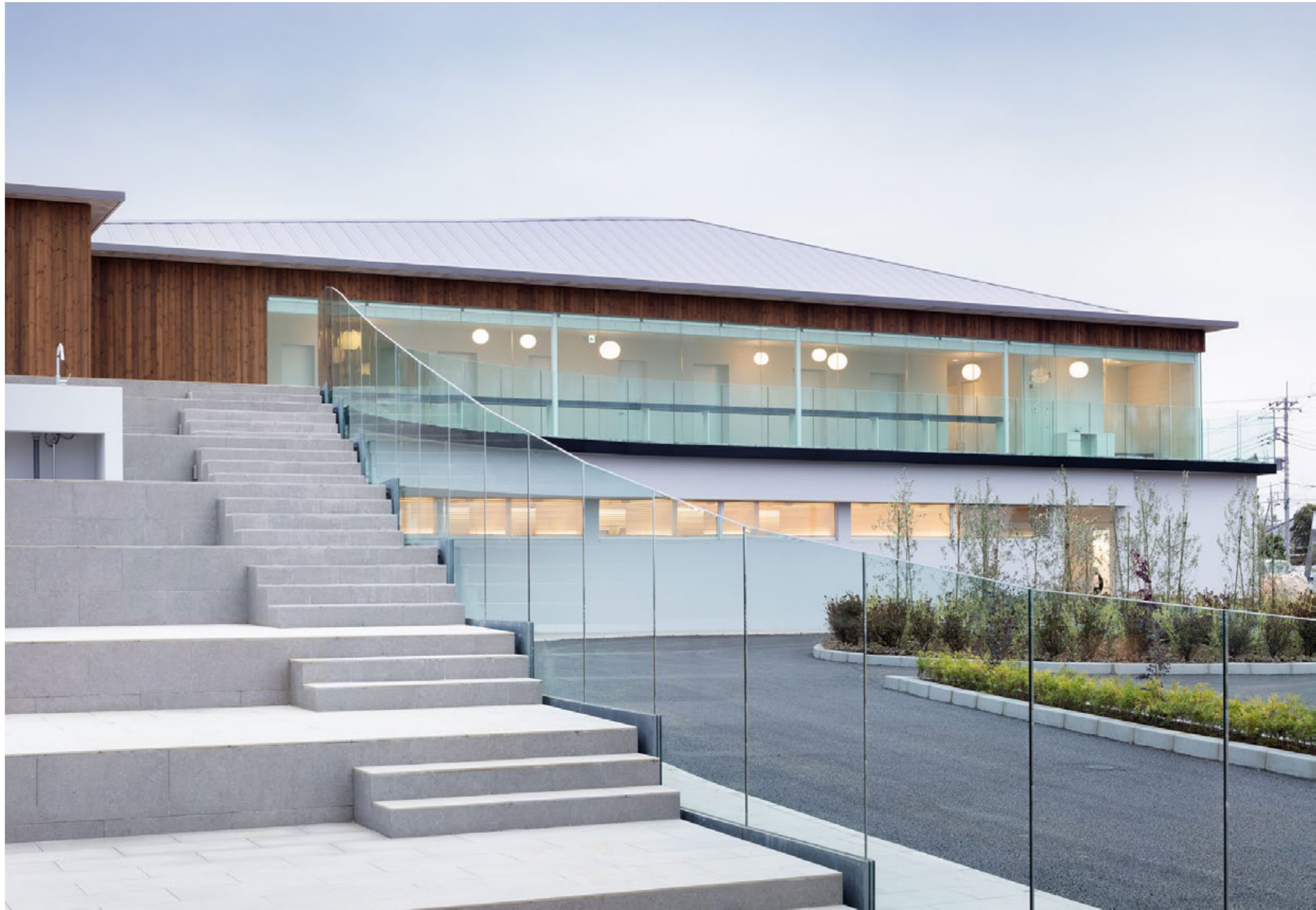
エントランスアプローチはセミナーが行える場所となっている