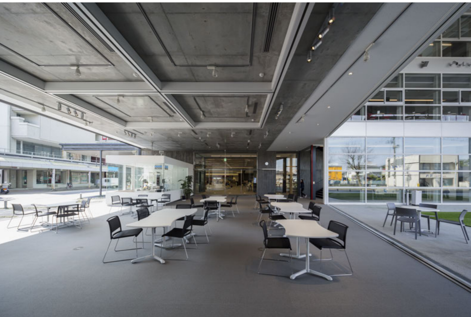
市民ラウンジ 2つの大型建具をフルオープンにして外部空間と連続させることが可能