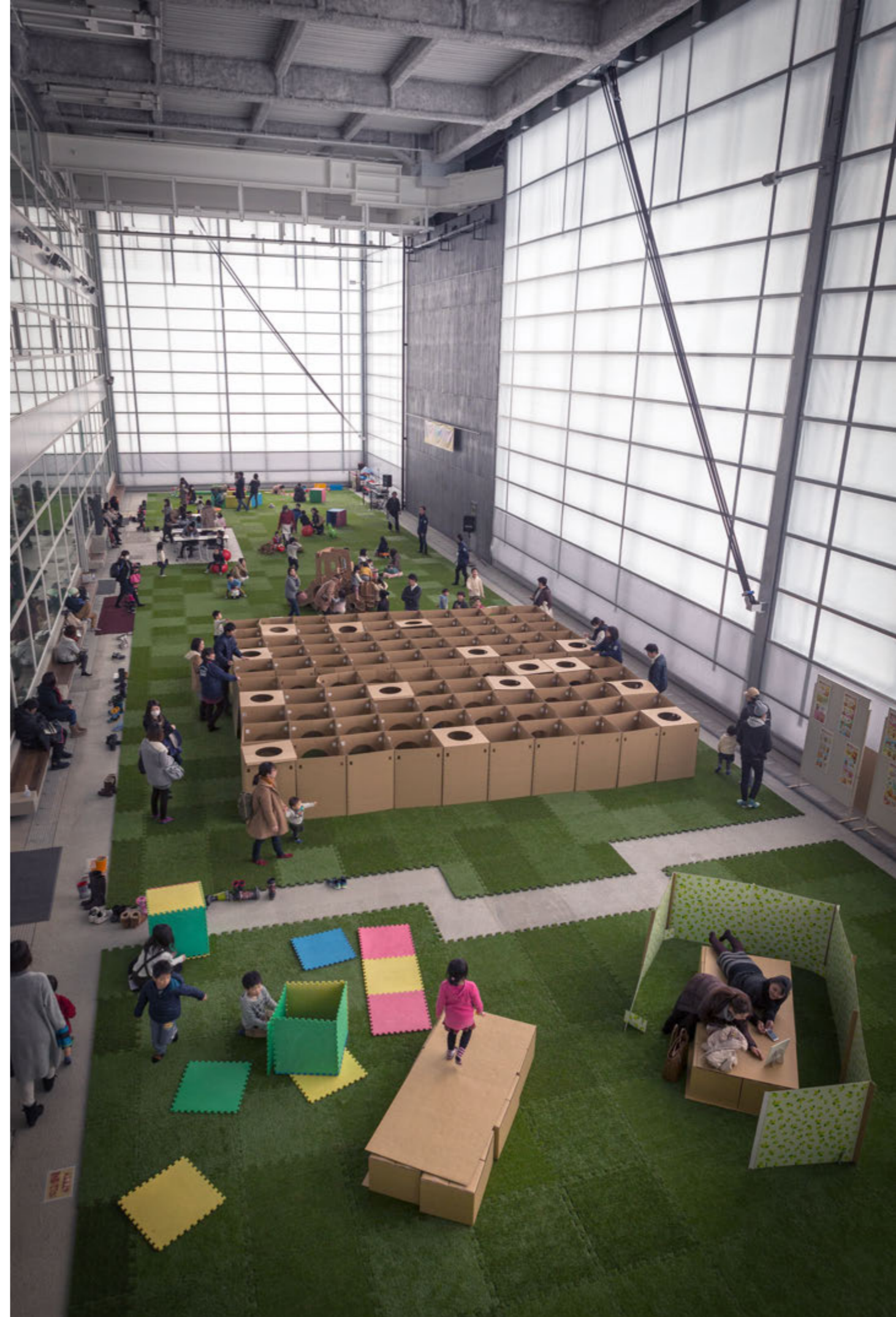
全面開放可能な大型シートシャッターを設けた半屋外イベント広場